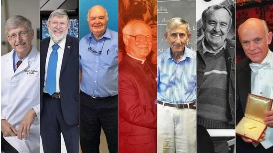
Científicos de fama mundial del siglo XXI que creen en Dios. De izquierda a derecha, Francis Collins, William Phillips, John Lennox, John Polkinghorne, Freeman Dyson, Allan Sandage y Richard Smalley.

Su búsqueda de respuestas como científico ateo llevó a Collins, primero, a reconocer la evidencia de Dios. Y, tras una fuerte experiencia mientras hacía alpinismo, a abrazar la fe cristiana: "Intentaba entender por qué personas intelectualmente sofisticadas podían creer en Dios. Para mi consternación, encontré que el ateísmo resultó ser la menos racional de todas las posibles elecciones. (...) El Dios de la Biblia es también el Dios del genoma. Se le puede adorar en la catedral o en el laboratorio".